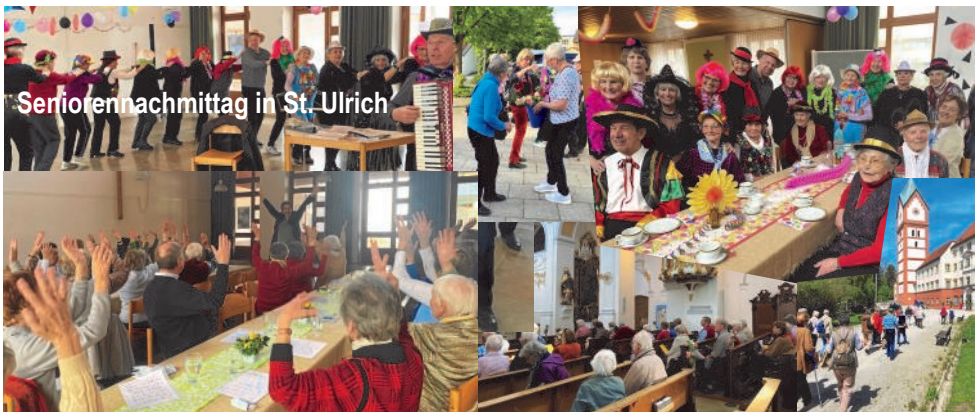
Seniorenachmittag in St. Ulrich

veranstaltet vom „Ökumenischen Kreis Unterschleißheim“